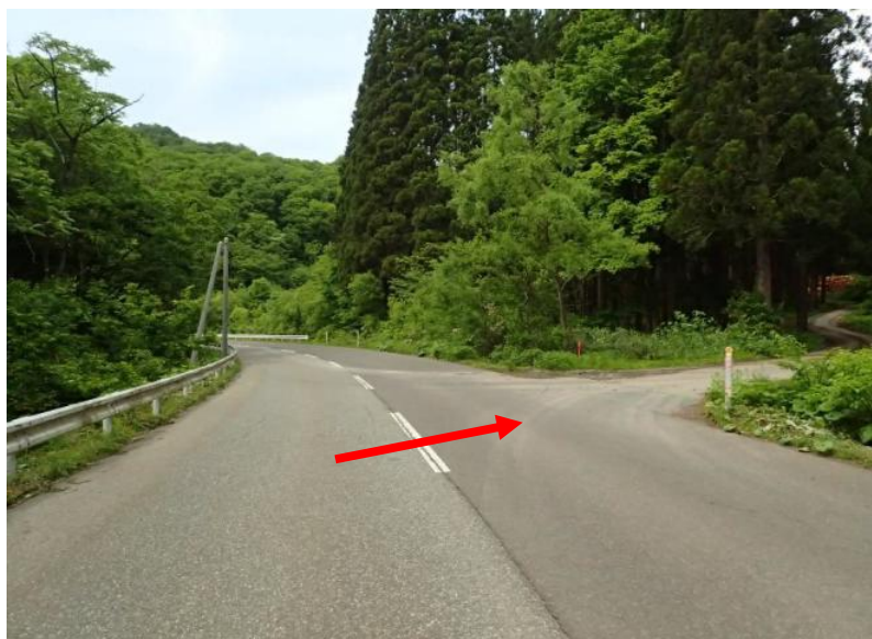
国道46号線から国道341号玉川方面へ、約18k m先を尻高沢林道へ右折