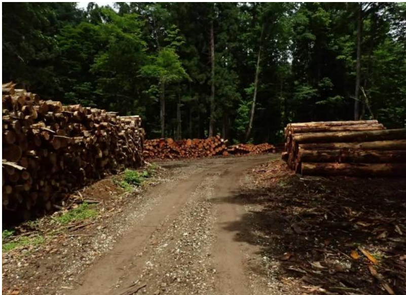
ゲートから約1km先に巻立

クマによる人身被害防止の為、施錠による入山規制中（立入禁止エリア） （問合せ：秋田森林管理署 018-882-2311）