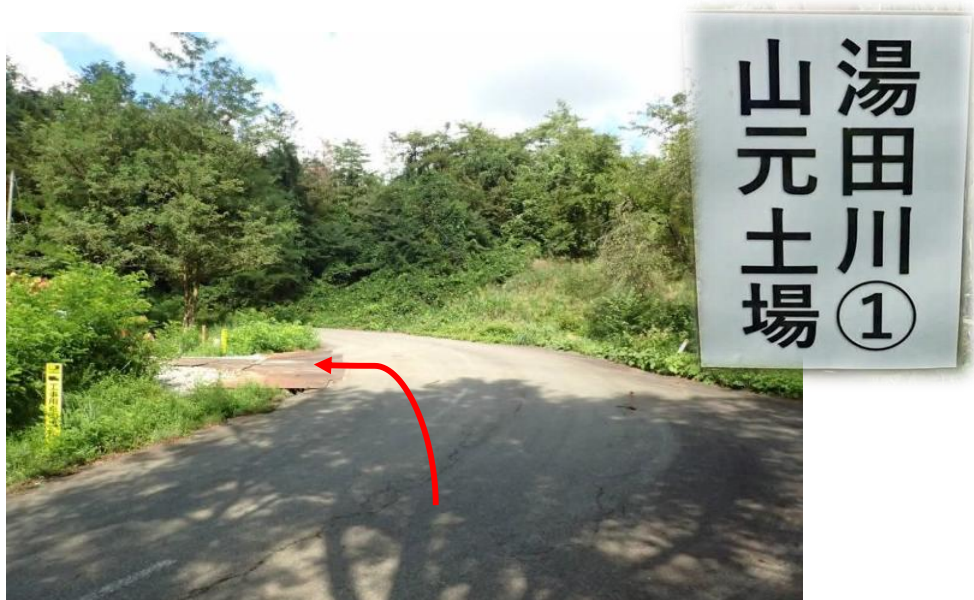
分岐直進から1.2 km先を左折し湯田川山元土場（11号・12号）