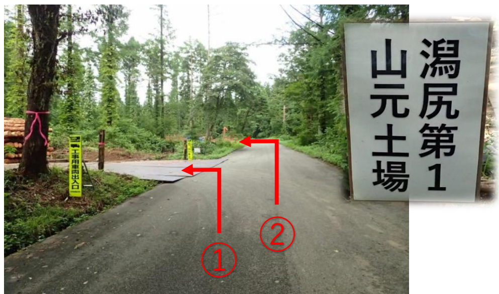
分岐直進から4.2 k m先を左折し瀧尻第1山元土場