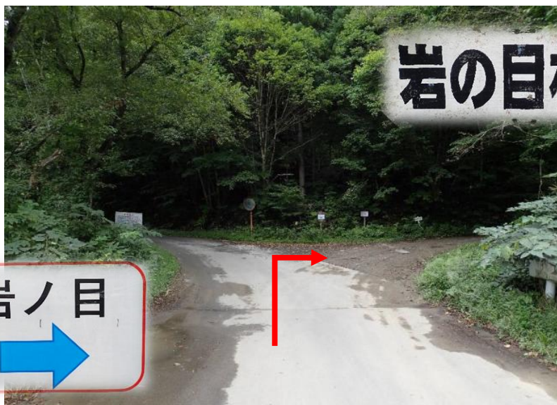
約2.3km先、いわのめ橋を渡った先を右折し岩の目林道へ