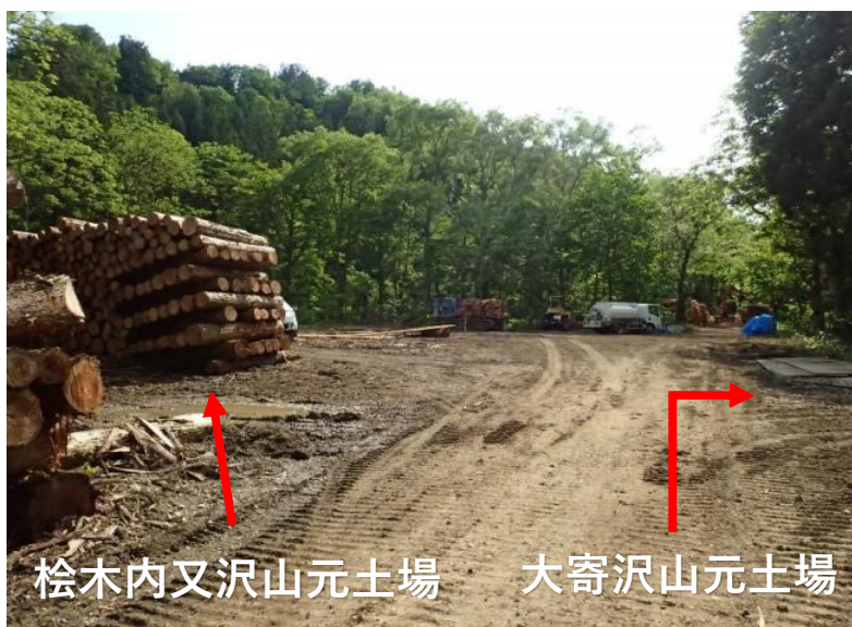
桧木内又沢山元土場