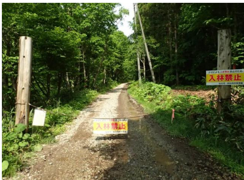
直進した先の上小和瀬林道入口ゲート