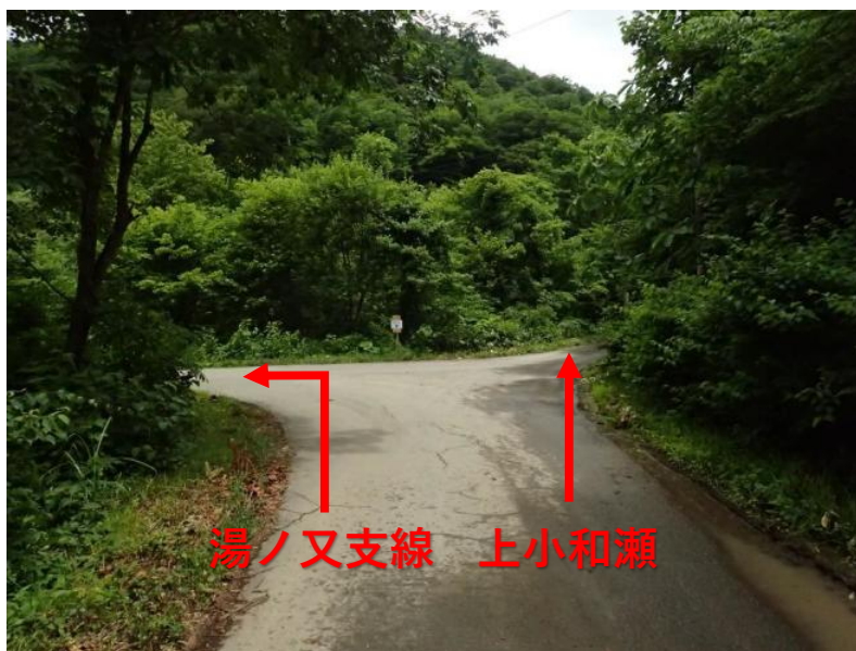
約6km先 左折：湯ノ又支線方面 直進：上小和瀬林道