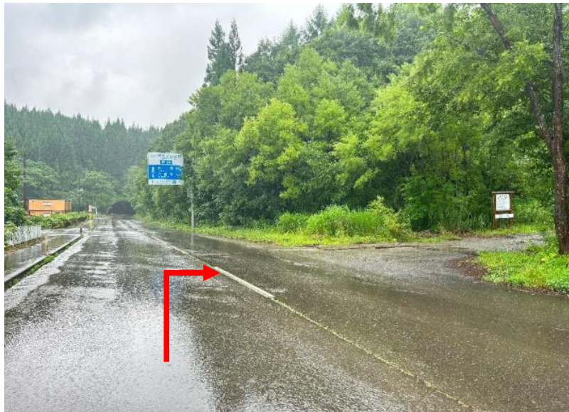
国道46号線から国道341号玉川方面へ 約16.2 km先を林業専用道鹿ノ作線へ右折