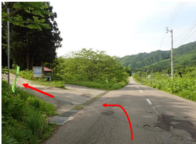
約34.2km先を左折し桧木内又沢林道へ（秋田内陸縦貫鉄道とざわ駅手前）