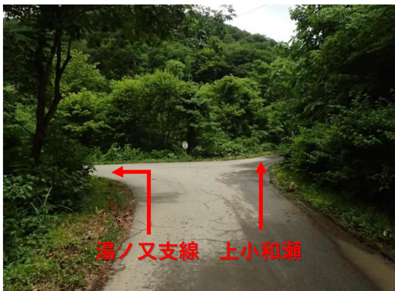
約6km先分岐 左折：湯ノ又支線方面 直進：上小和瀬林道