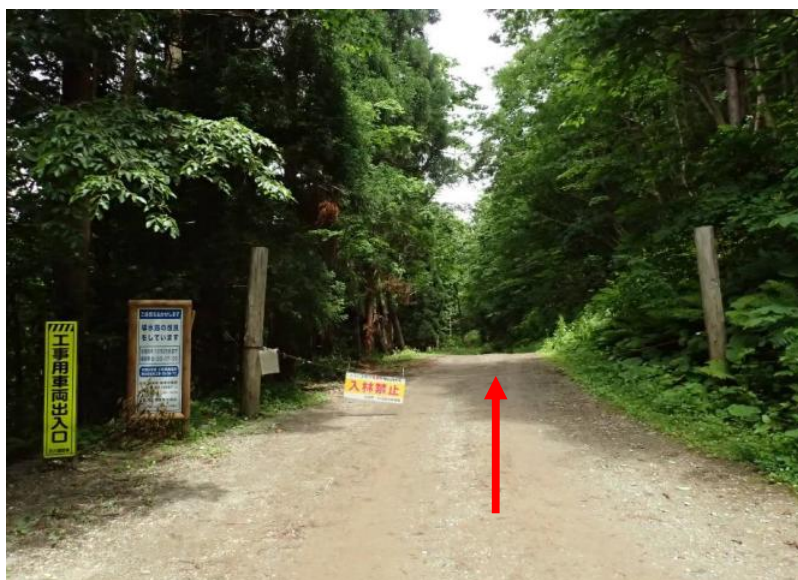
湯ノ又支線入口のゲート

クマによる人身被害防止の為、施錠による入山規制中（立入禁止エリア） （問合せ：秋田森林管理署 018-882-2311）