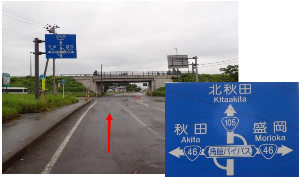
国道46号から国道105号北秋田方向へ