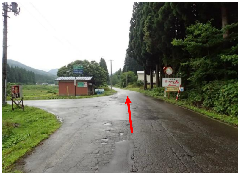
約1.3km先（六郷温泉あったか山への分岐を）直進