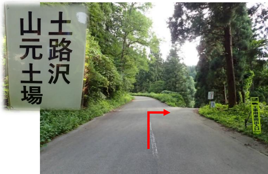
分岐直進から2.7 k m先を右折し土路沢山元土場