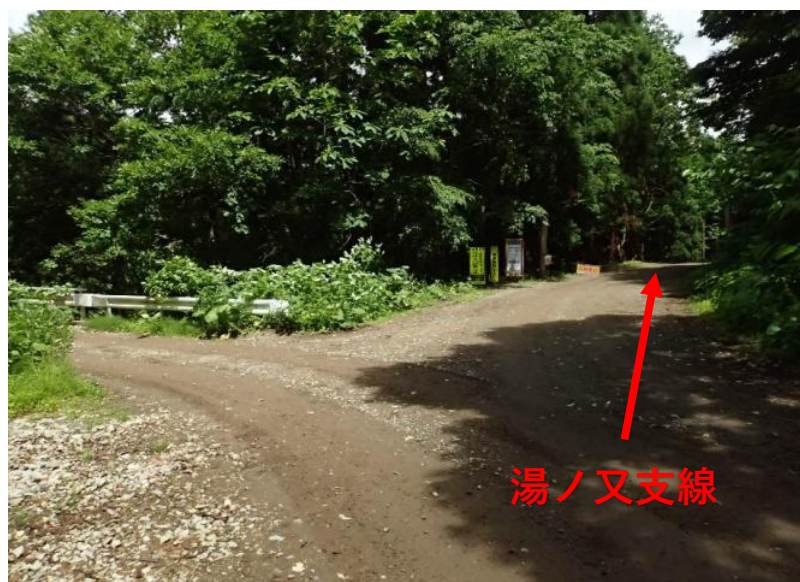
湯ノ又支線方向へ侵入し1.5km先 直進：湯ノ又支線入口