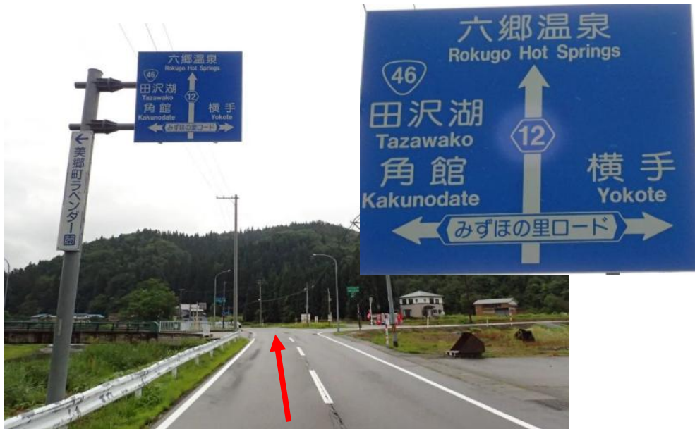
県道12号花巻大曲線とみずほの里ロードの交差点を六郷温泉方面へ