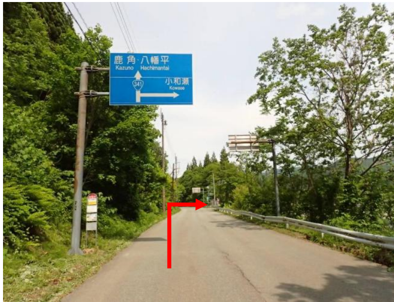
国道46号から国道341号へ入り約27km先を小和瀬方面へ右折